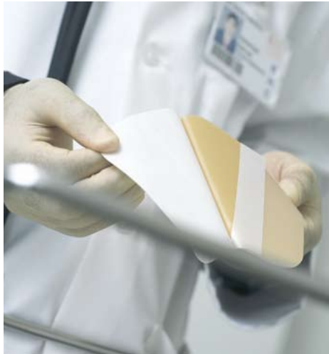
Hydroaktive Verbände stärken die körpereigenen Abwehrkräfte und beschleunigen den Heilungsprozess.

Hydroaktive Verbände helfen bei diabetischem Fuß