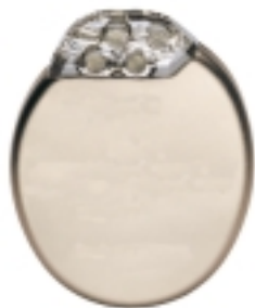
Moderne ICDs haben ein Titangehäuse, sind weniger als 10 mm dick und wiegen max. 75 Gramm

Neue Technologien retten vielen Menschen das Leben